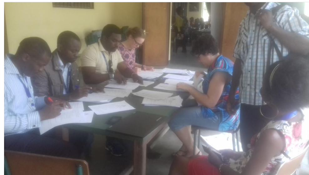
L'équipe de Mercy Ship lors de la correction des Pré tests